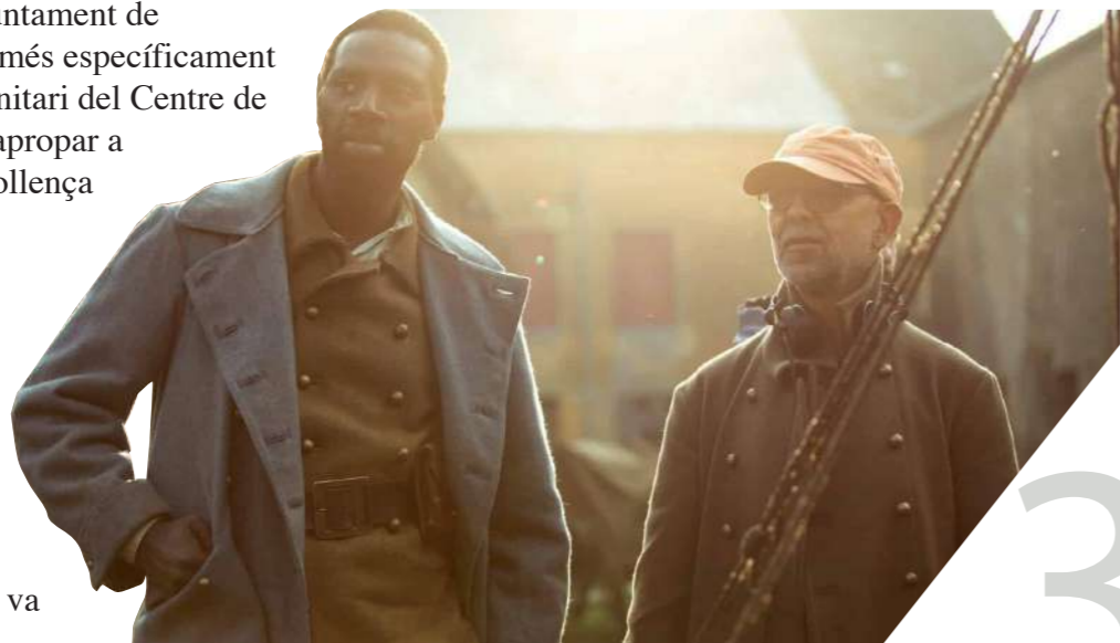
Omar Sy durant el rodatge de la pel·lícula "Tirailleurs", 2022.

Aquestes són algunes de les raons per les quals l'Ajuntament de Kafountine, i més específicament el personal sanitari del Centre de Salut, es van apropar a l'ONGD de Pollença TASNI per formular un programa de millora de l'accés sanitari a les illes Bliss Karone, un programa que va